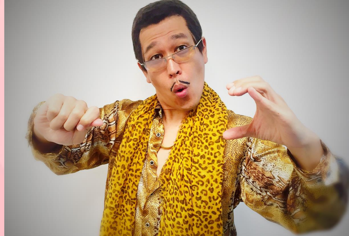
トーク・ライブゲスト ピコ太郎