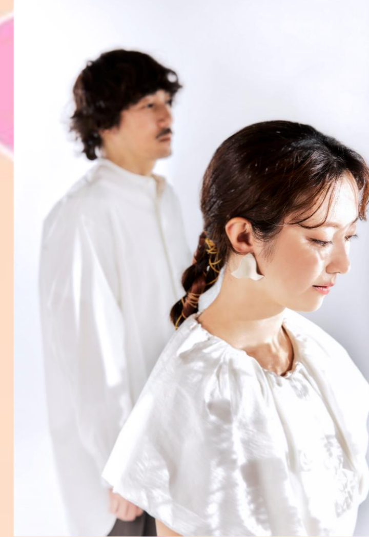
トーク・ライブゲスト moumoon